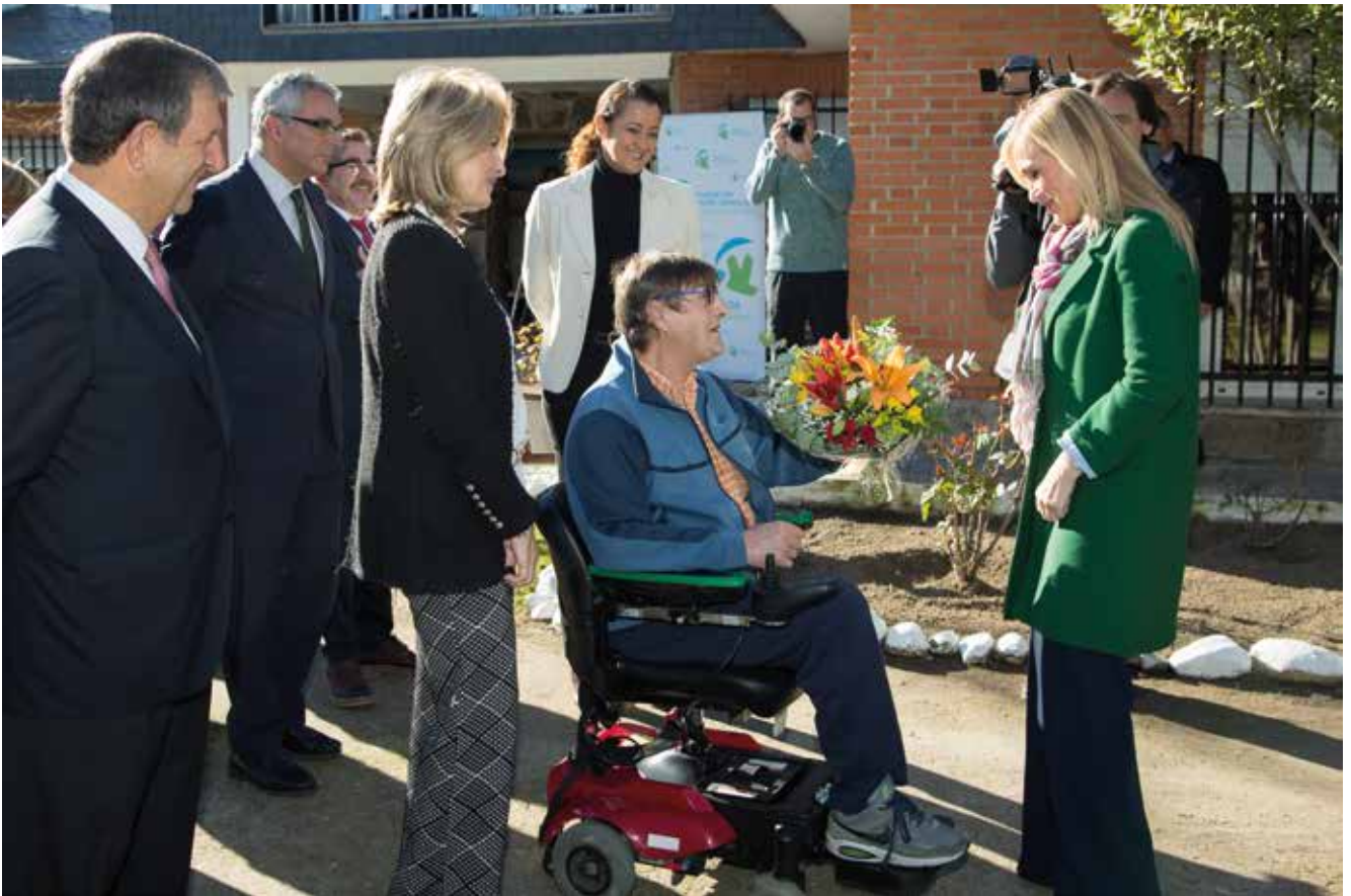
▲ Recibimiento a la presidenta regional en el centro de acogida.